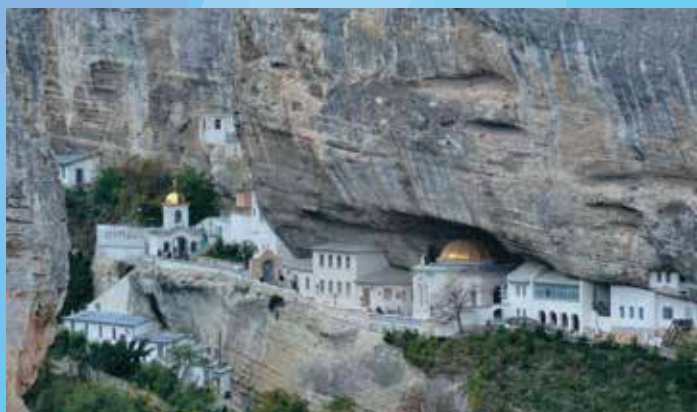
«Успенский монастырь» Бахчисарай