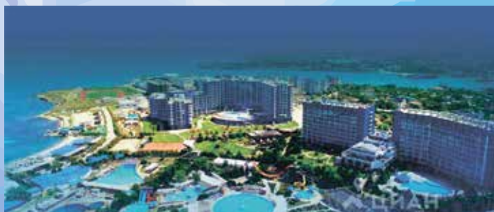
Aquamarine Resort & SPA *****