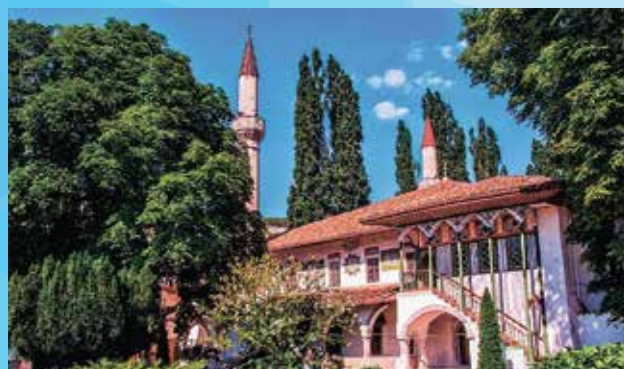
«Ханский дворец» Бахчисарай